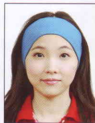
臉部及雙 耳被物品 遮蔽