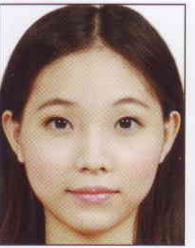
頭髮碰觸到 照片邊框