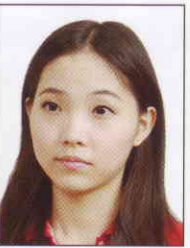
頭部側向 一邊、未 正視鏡頭