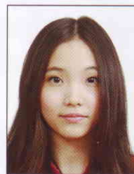
頭髮遮蔽 到眼睛或 耳朵